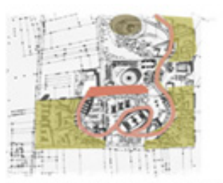
ος - αλληλοσυσχέτιση